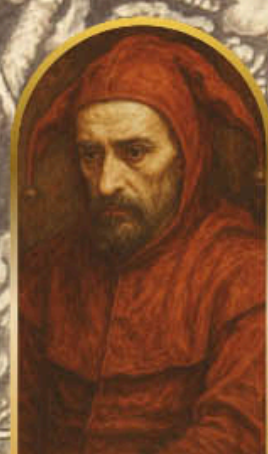
Stańczyk Błazen (1480 - 1562)

Był ostatnim wielkim mistrzem zakonu krzyżackiego, a następnie księciem Prus. Po przegranej wojnie z Polską, dokonał sekularyzacji państwa zakonnego, przeszedł na luteranizm i złożył hold lenny królowi Polski Zygmuntovi I Staremu. W ten sposób powstały Prusy Książęce, które stały się pierwszym protestanckim państwem. Utworzone w ten sposób księstwo było lennem Polski; wyznaniowo i organizacyjnie w całości protestanckie. Albrecht Hohenzollern był siostrzeńcem Zygmunta Starego. To mogło wpływać na łagodniejsze traktowanie przeciwnika w rokowaniach.