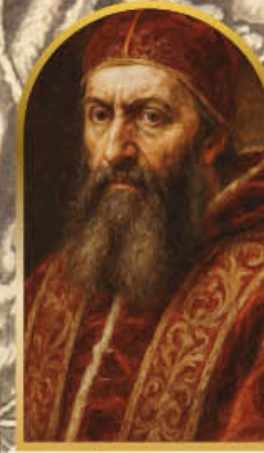
Klemens VII Papież (1478 -1534)

Przez większość życia koncentrował się na reformach religijnych, jego nauki i pisma zaczęły oddziaływać na członków Zakonu w latach 20. XVI w. W 1523 roku Albrecht Hohenzollern spotkał się z Lutrem w Wittenberdze. Pod wpływem Lutra, Albrecht w 1525 roku ogłosił sekularyzację Prus Zakonnych, tworząc Księstwo Pruskie jako świeckie państwo luteranckie. Było to pierwsze państwo luteranckie na świecie. Choć Luter cieszył się z jego powstania, był świadomy, że formalnie pozostaje ono lennem katolickiego króla Polski. Nie krytykował tego otwarcie ale liczył, że wpływ protestantyzmu będą się w Rzeczypospolitej rozszerzać.