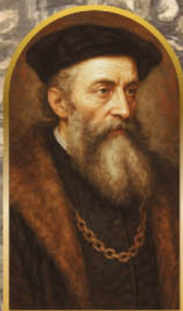
Albrecht Hohenzollern Wielki mistrz zakonu krzyżackiego (1490-1568)

Królowa Polski i wielka księżna litewska, żona Zygmunta I Starego. Bona wspierała męża w decyzji o podjęciu działań zbrojnych przeciw zakonowi, udzielała mu rad oraz mobilizowała środki finansowe z własnych dóbr królewskich. Towarzyszyła dyplomatycznie w rozmowach z cesarzem i papieżem w celu uzyskania korzystnej pozycji dla Polski. Była orędowniczką silniejszego włączenia Prus do gospodarki Korony. Po wojnie pruskiej umiała wpływ na rozmowy dyplomatyczne prowadzące do rozejmu toruńskiego. Bona określana była jako „pani, której boją się wszyscy dworzanie króla” — sugerowano, że ma większy wpływ na politykę niż Zygmunt w sprawach krzyżackich.