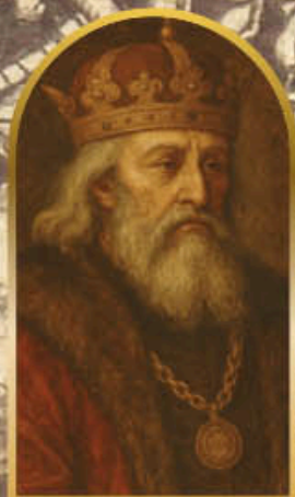
Zygmunt Stary Król Polski (1467 - 1548)

Król Zygmunt I Stary był jednym z najwybitniejszych władców z dynastii Jagiellonów. W jego czasach zakończył się wieloletni konflikt z Zakonem Krzyżackim. Wielki mistrz Albrecht Hohenzollern, odmówił złożenia holdu lennego, co doprowadziło do wojny polsko-krzyżackiej. Po rozejmie Albrecht, pod wpływem Marcina Lutra, zsekularyzował państwo zakonne i przyjął luteranizm. W 1525 roku na rynku w Krakowie złożył Zygmuntowi uroczysty hold lenny, uznając Księstwo Pruskie za lenno Polski. Wydarzenie to przeszło do historii jako Hold Pruski.