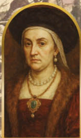
Bona Sforza d'Aragona Królowa Polski (1494 - 1557)

Król Zygmunt I Stary był jednym z najwybitniejszych władców z dynastii Jagiellonów. W jego czasach zakończył się wieloletni konflikt z Zakonem Krzyżackim. Wielki mistrz Albrecht Hohenzollern, odmówił złożenia holdu lennego, co doprowadziło do wojny polsko-krzyżackiej. Po rozejmie Albrecht, pod wpływem Marcina Lutra, zsekularyzował państwo zakonne i przyjął luteranizm. W 1525 roku na rynku w Krakowie złożył Zygmuntowi uroczysty hold lenny, uznając Księstwo Pruskie za lenno Polski. Wydarzenie to przeszło do historii jako Hold Pruski.