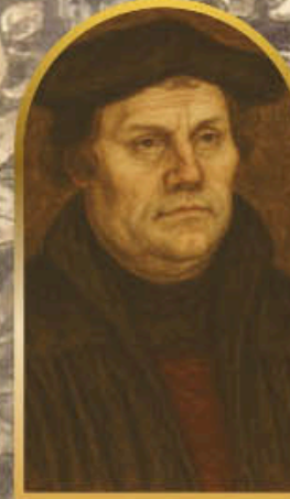
Marcin Luter Duchowny, reformator (1483–1546)

Podczas wojny Pruski z Zakonem w latach 1519–1521 Kopernik był administratorem dóbr kapituły warmińskiej. W 1521 r. dowodził obroną zamku w Olsztynie przed wojskami wielkiego mistrza Albrechta Hohenzollerna. Odpowiadał za organizację obrony, zaopatrzenie i strategię. Słynna jest jego odręczna mapa Olsztyna i okolic, na której zaznaczył pozycje wojsk i punkty obronne. Po wojnie był wysyłany do rozmów z Krzyżakami, m.in. w sprawie granic, wymiany jeńców i zwrotu dóbr kościelnych. Zdokumentów wynika, że Kopernik kilkakrotnie korespondował lub pośrednio kontaktował się z Albrechtem Hohenzollernem w sprawach politycznych i gospodarczych.