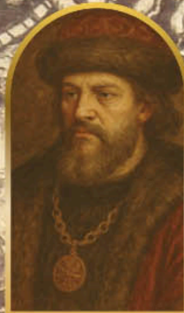
Janusz III Książę Mazowiecki (1502 - 1526)

Janusz III był ostatnim męskim przedstawicielem dynastii Piastów mazowieckich. Podczas wojny pruskiej wysłał mazowieckie pospolite ruszenie, które zdobyło zamek w Pisz, wsparł w ten sposób działania Zygmunta Starego przeciwko zakonowi. W 1525 roku miał miejsce Hold Pruski. Poselstwo pruskie, udające się z Królewca do Krakowa, aby wziąć udział w ceremonii, przechodziło przez terytorium Księstwa Mazowieckiego. Janusz III gościł wysłanników Albrechta i zapewnił im bezpieczny przejazd. Choć Mazowsze było formalnie niezależne, książę utrzymywał bliskie relacje z królem i uczestniczył w życiu politycznym Rzeczypospolitej. Po jego śmierci Mazowsze zostało włączone do Korony.